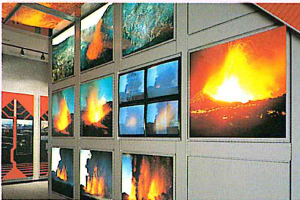
▲防災展示室 火山最前線

伊豆大島火山博物館は、世界にも数少ない火山専門の博物館です。火山最前線・世界の火山紀行・火山の百科の展示室のほか大島の美しい自然と人々の生活の様子を迫力の70ミリのワイド・スコープ映画で見せる映像ホール(300席)、シミュレータ・カプセル(8席)で火山地底探検もできるユニークな博物館です。