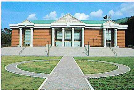
▲伊豆大島火山博物館