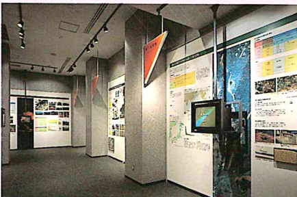
▲火山展示室2 火山の百科