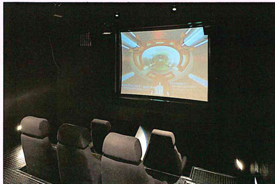
▲シミュレータ・カプセル