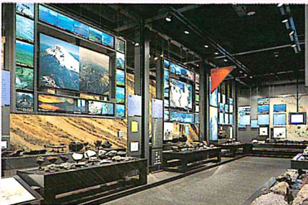
▲火山展示室1 世界の火山紀行