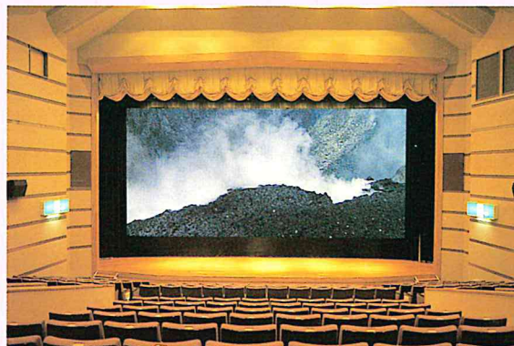
▲ワイド・スコープ映画